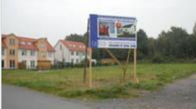
Noch freie Fläche: Bald werden hier Irina und Jasmin, ihres Zeichens Energiesparhäuser, stehen.